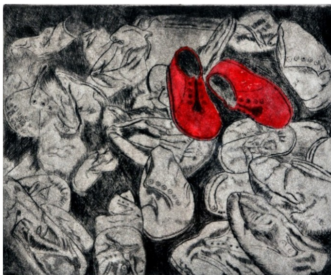
Franco Inz, Scarpette rosse (incisione colorata)

Casa della Memoria della Resistenza e della Deportazione di Vinchio